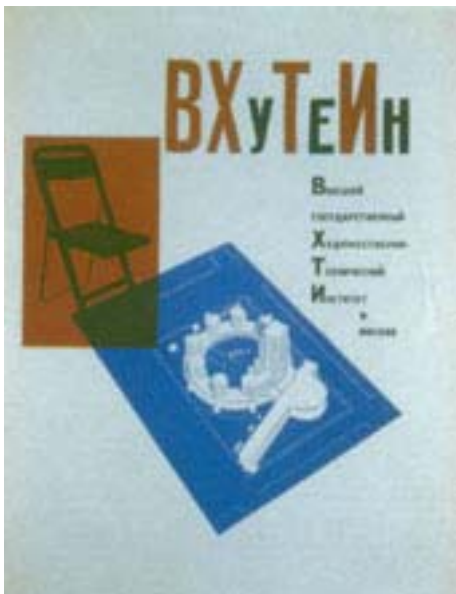
Esempio di grafica influenzata dalla fotografia zenitale