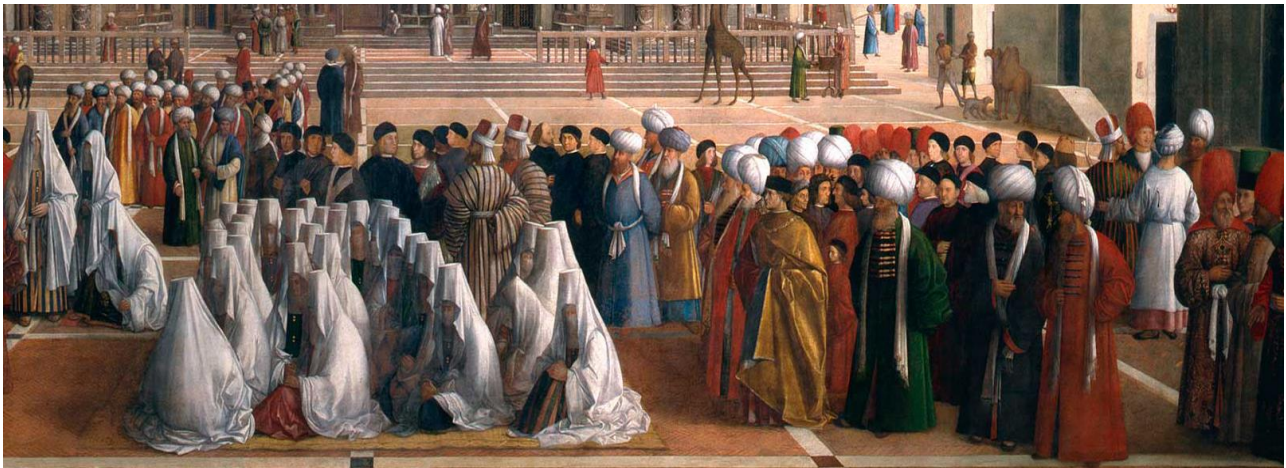
G. Bellini, Predica di san Marco ad Alessandria, 1504-07